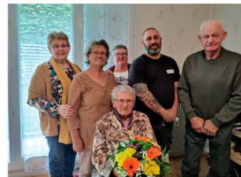
Locataire centenaire - Visite à domicile

Toujours soucieux d' être au plus près de ses locataires, les équipes ont pu reprendre leurs actions de proximité pour partager des moments de convivialité.