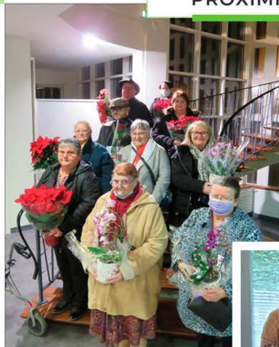
Concours Floral - Remise de prix

Toujours soucieux d' être au plus près de ses locataires, les équipes ont pu reprendre leurs actions de proximité pour partager des moments de convivialité.