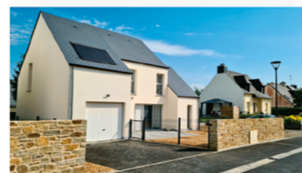
Javené : 3 pavillons en location-accession

Depuis de nombreuses années, Fougères Habitat accompagne les communes pour construire des logements de qualité. 2020 aura été une année riche en livraison !