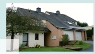
ORIERE - Fougères

Objectifs : apporter un service différent aux fougérais et insérer de petites opérations dans le milieu urbain.