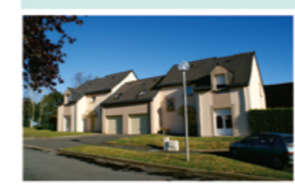
LÉCOUSSE La Butte

280 pavillons ont été construits et plus de 2 000 appartements ont été réhabilités dans les grands collectifs fougérais afin d'améliorer le logement et la qualité de vie des locataires.