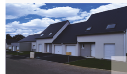
Saint Marc le blanc : 4 pavillons