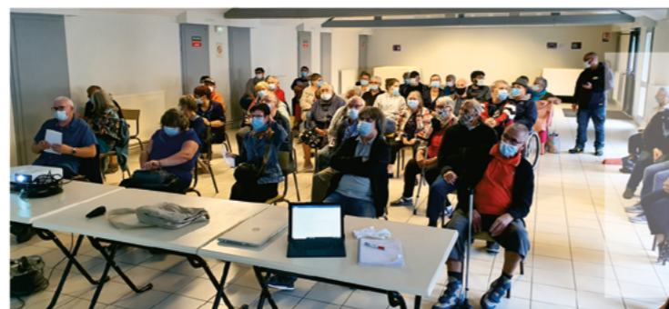
Réunion d'informations avec les locataires le 23 septembre dernier

« Les travaux vont s'articuler sur plusieurs mois et nous sommes conscients des contraintes pour les habitants » ajoute-t-il. « La finalité est d'améliorer le confort de vie. Il n'y aura plus de maintenance dans les logements et chaque foyer pourra gérer sa propre consommation de chauffage et d'eau chaude! ».