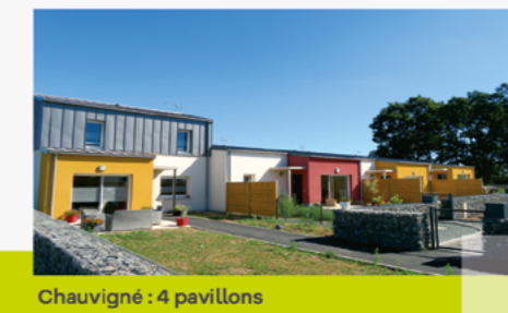
Chauvigné : 4 pavillons

■ Baillé : Acquisition de 3 pavillons à la commune, rénovés en 2020